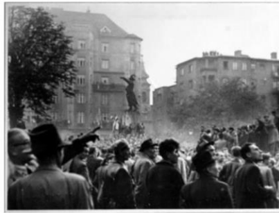
a Bem-szobornál és a Sztálin szobor ledöntésekor